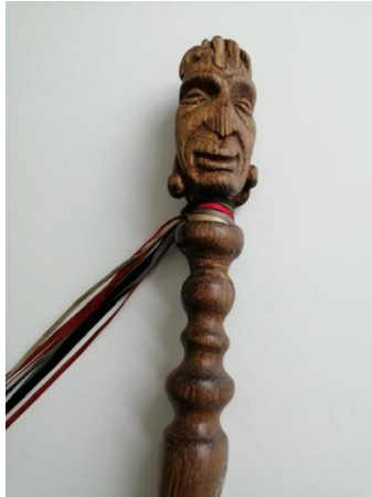
detail van de scepter

De scepter (teken van macht) die hij ontvangt is en blijft eigendom van het Heilig Wammes. Deze is vervaardigd uit hout en gesneden door de Maaseiker kunstenaar Segge (Segers Gerard). Na zijn prinsenjaar wordt de scepter teruggegeven aan de raad van elf. Is de Prins zijn scepter kwijt (of is hij door iemand anders meegenomen) dan kost het hem minstens één vat bier als de scepter teruggevonden (gegeven) wordt.