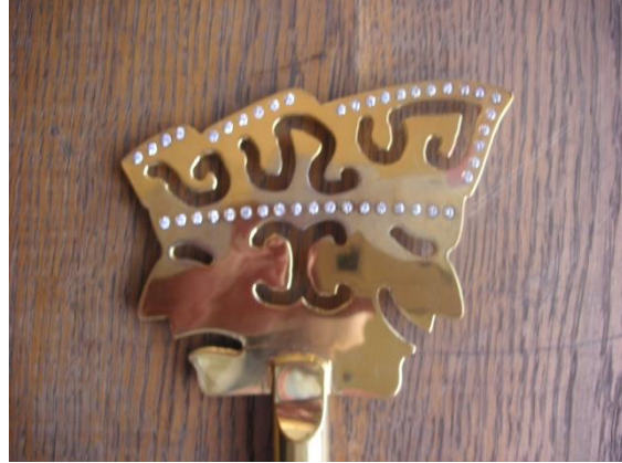
detail van de sleutel

Tegelijkertijd kijken “d’aw wi-jver” goedkeurend toe om na de receptie met de Prins en de raad van elf het Maaseiker carnavalsfeest op gang te trekken. In de cafés organiseert men Miss verkiezingen, wie krijgt de titel: “sjoenste awt wi-jf van het jaar?”.