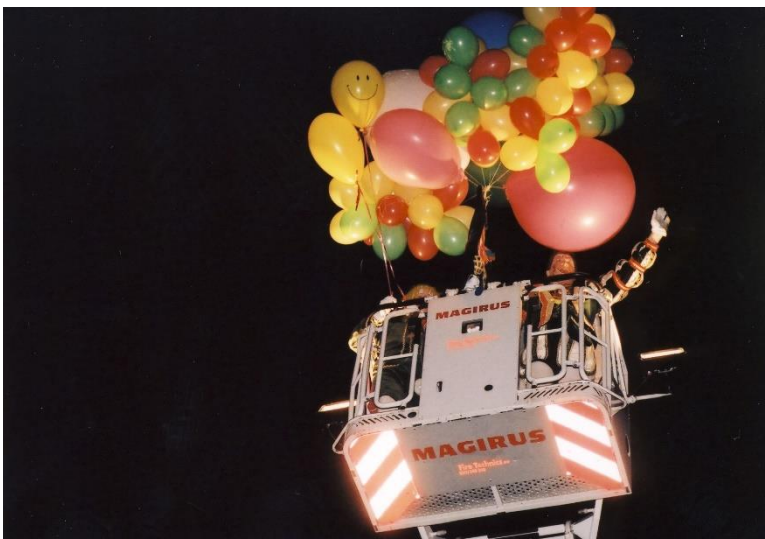
Het oplaten van het “wejmëske”

Dinsdagavond wordt “kloonjendieënsdig” georganiseerd. Verkleed als “kloonj” vertrekt er om 20u11 een optocht door het centrum van de stad. Na de optocht wordt op de markt door de Jeugdprins en de Prins het “wejmëske” (wambuis) vastgemaakt aan vele ballonnen, opgelaten. De aanwezigen zingen ondertussen de “Mezeiker Brabançonne”, “sterk es Eik”.